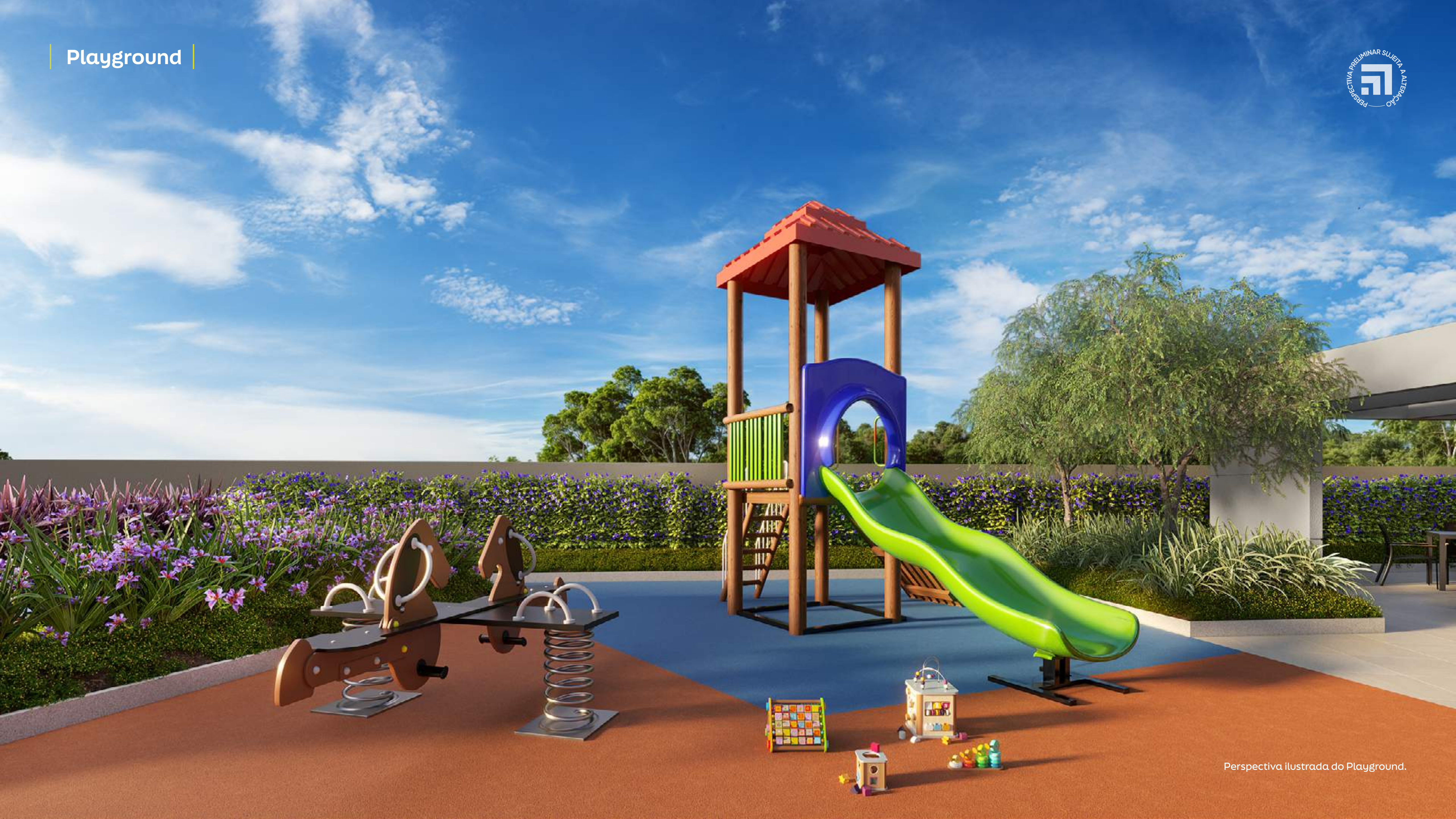
Perspectiva ilustrada do Playground.