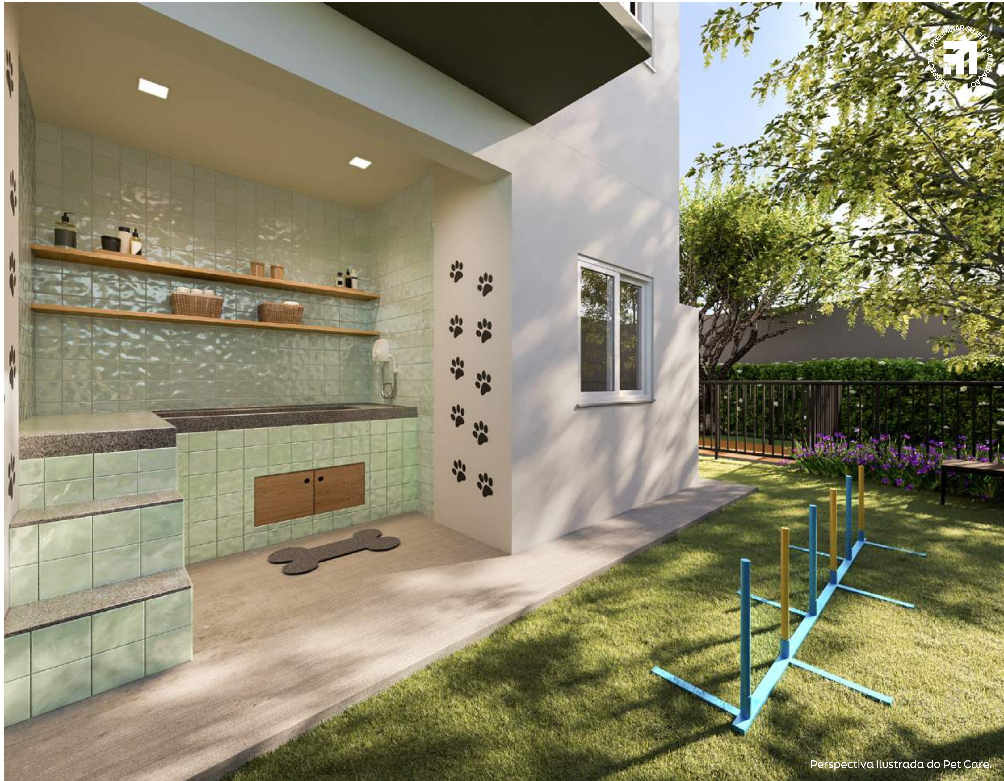
Perspectiva ilustrada do Pet Care.