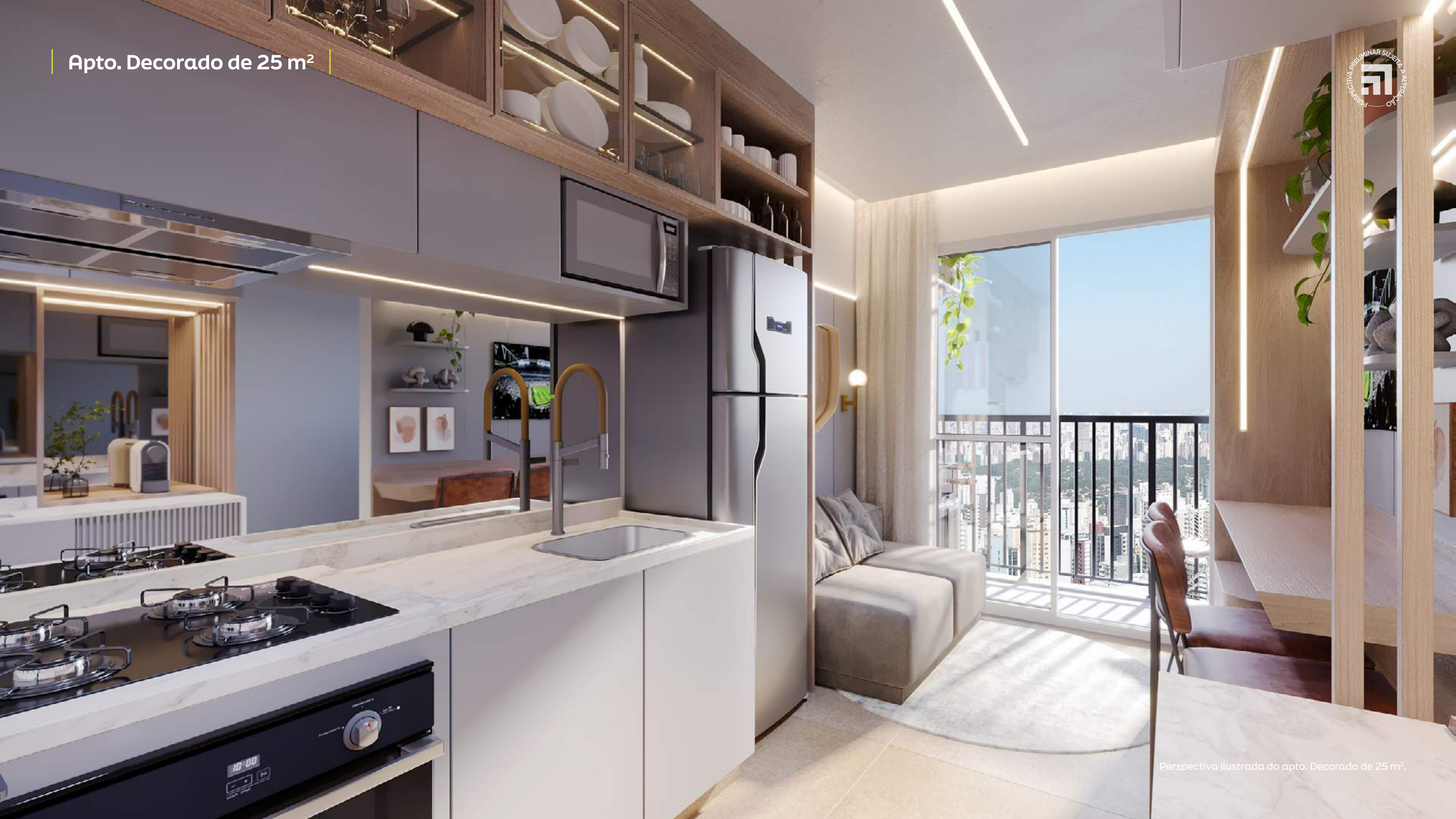
Perspectiva ilustrada do apto. Decorado de 25 m 2 .