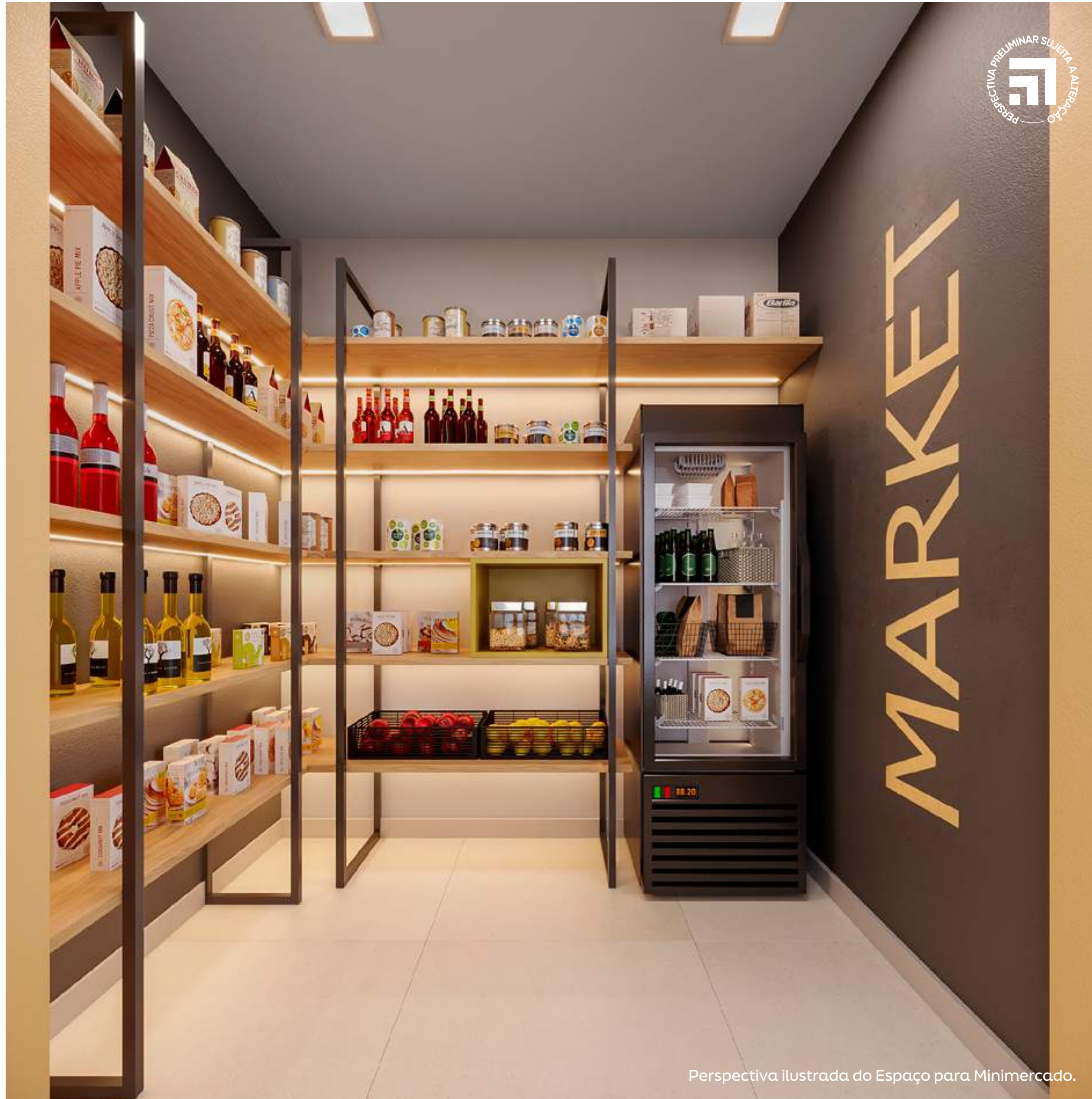
Perspectiva ilustrada do Espaço para Minimercado.