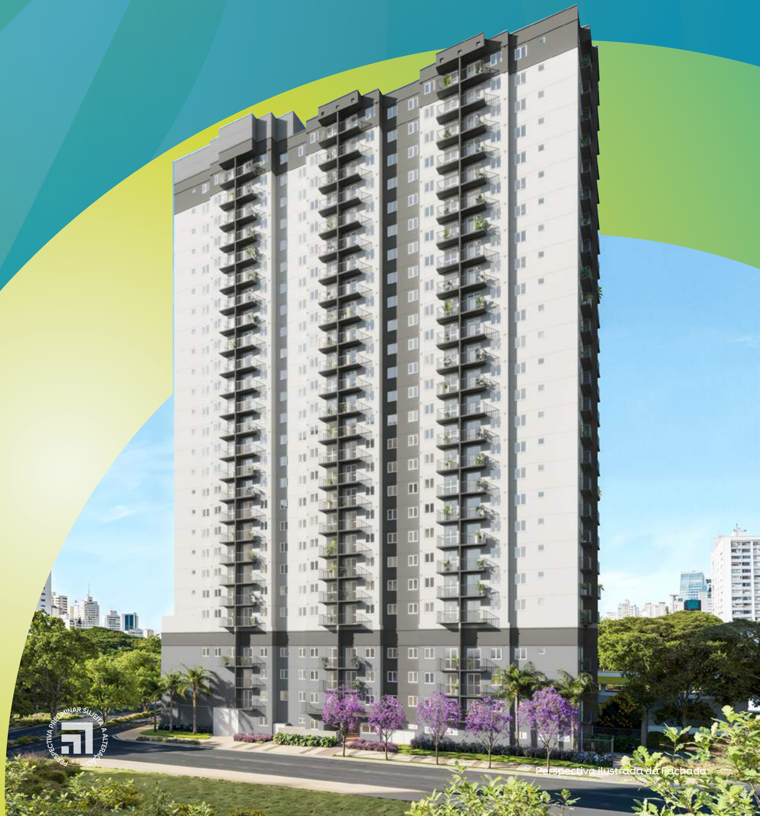
Perspectiva ilustrada da Fachada.