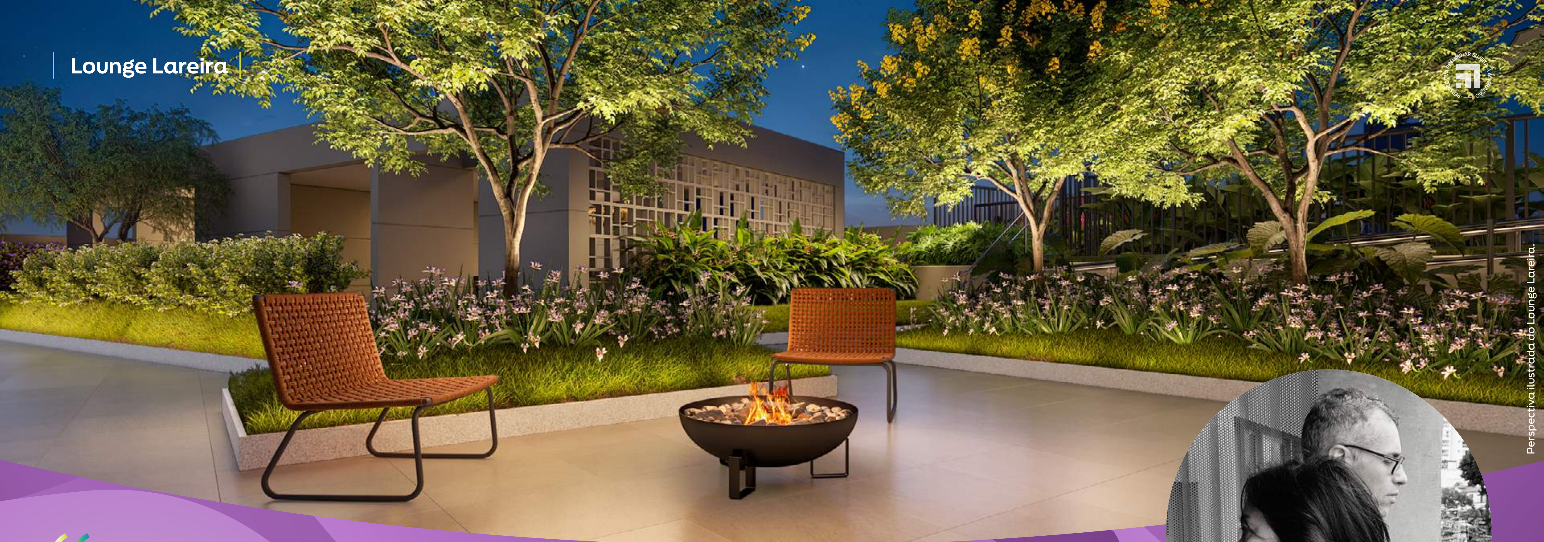
Perspectiva ilustrada do Lounge Lareira.