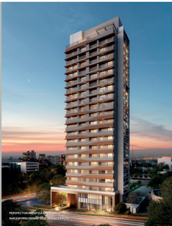
PERSPECTIVA ARTÍSTICA DA FACHADA IMAGEM PRELIMINAR SUJEITA A ALTERAÇÃO