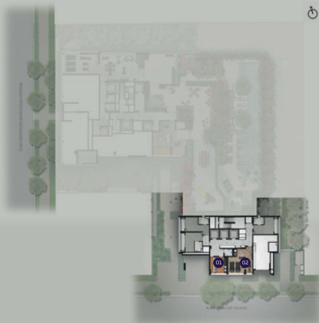
PERSPECTIVA ARTÍSTICA DO 1º PAVIMENTO IMAGEM PRELIMINAR SUJEITA A ALTERAÇÃO