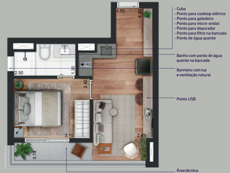
ILUSTRAÇÃO ARTÍSTICA DA PLANTA 1 DORM. IMAGEM PRELIMINAR SUJEITA A ALTERAÇÃO

Os móveis, equipamentos e utensílios utilizados nas perspectivas ilustradas são meras sugestões de decoração e não fazem parte do Contrato de Compra e Venda. Esses áreas serão entregues conforme Memorial Descritivo de Acabamentos e Plantas anexas ao contrato. O apartamento poderá sofrer pequenos ajustes decorrentes do desenvolvimento dos projetos executivos de estrutura, arquitetura e instalações. As medidas dos ambientes são de face a face das paredes com revestimento.