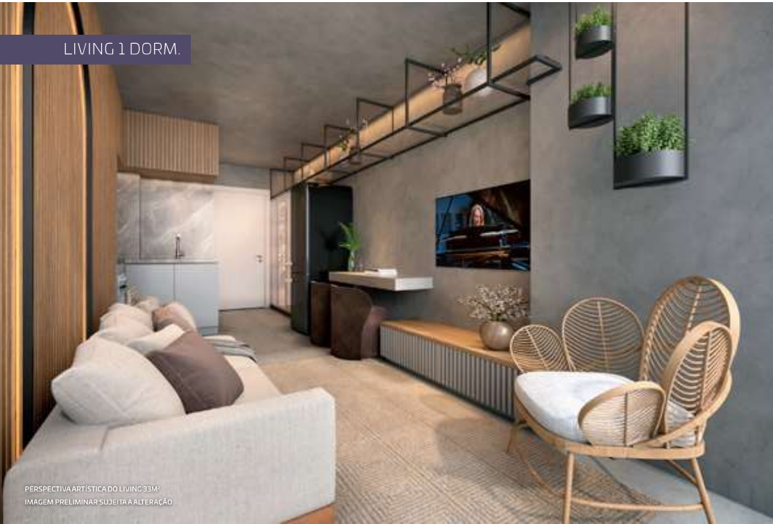
PERSPECTIVA ARTÍSTICA DO LIVING 33M 2 IMAGEM PRELIMINAR SUJEITA A ALTERAÇÃO