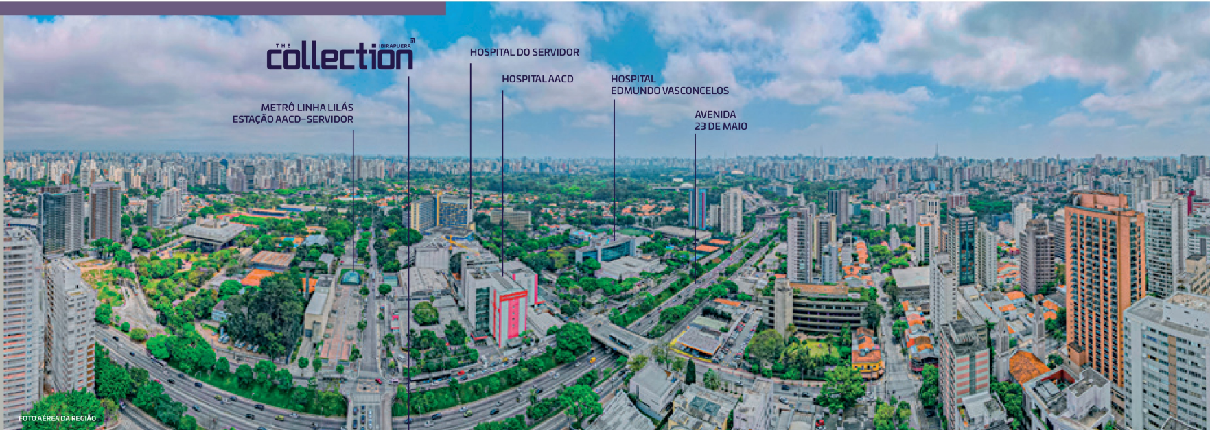
FOTO AÉREA DA REGIÃO