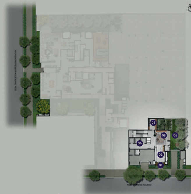
PERSPECTIVA ARTÍSTICA DA IMPLANTAÇÃO IMAGEM PRELIMINAR SUJEITA A ALTERAÇÃO

MAIS PRATICIDADE E CONVENIÊNCIA PARA O SEU DIA A DIA. LAZER, COWORKING E LOJAS INTEGRADAS AO CONDOMÍNIO.